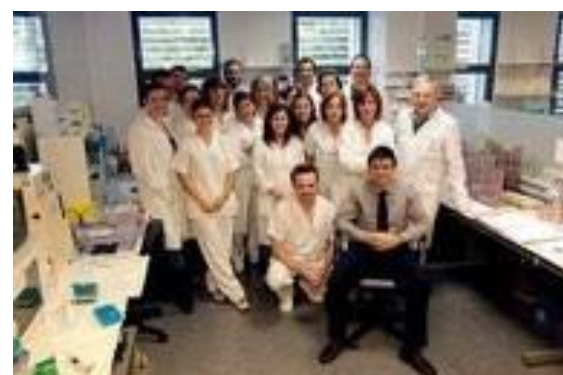
PRIS 27 Plataforma diagnóstico - Microbiología