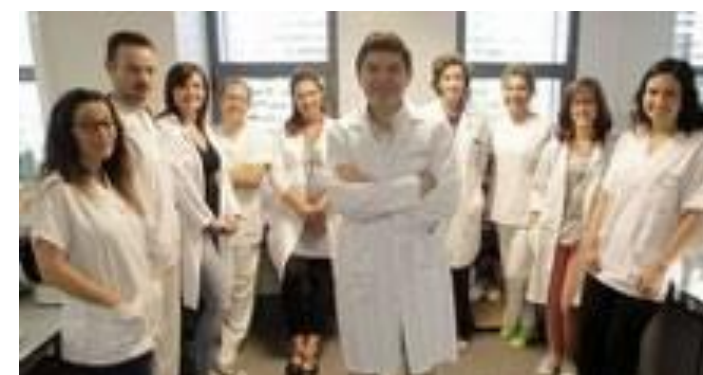
PRIS 28 Plataforma de Vacunas - Microbiología