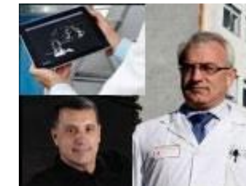
PRIS 30 Hemotool- Cardiología