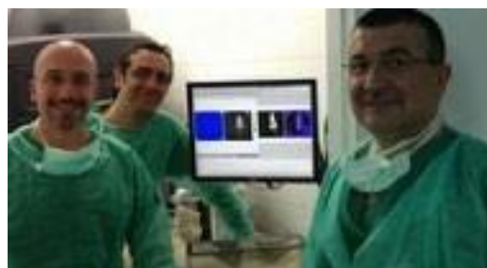
PRIS 07 M-Trap Oncología