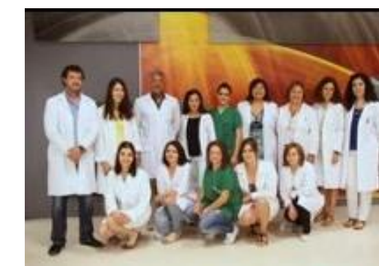
PRIS 14 Nefrochus- Nefrología