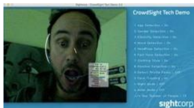
PRIS 16 Emocional Training - Psiquiatría