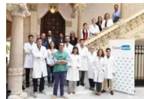
PRIS 08 Predi-CTC- Oncología