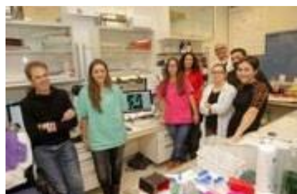
PRIS 06 Obstetricia- Músculo