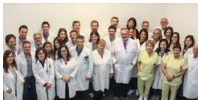
PRIS 03 Neurología